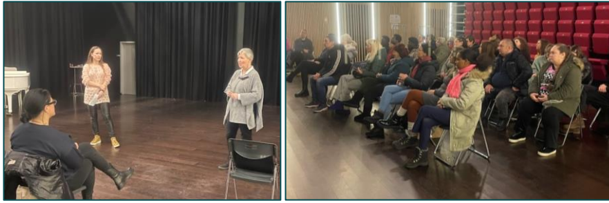
Flyktningetjenesten om jobb og bedriftsetablering.