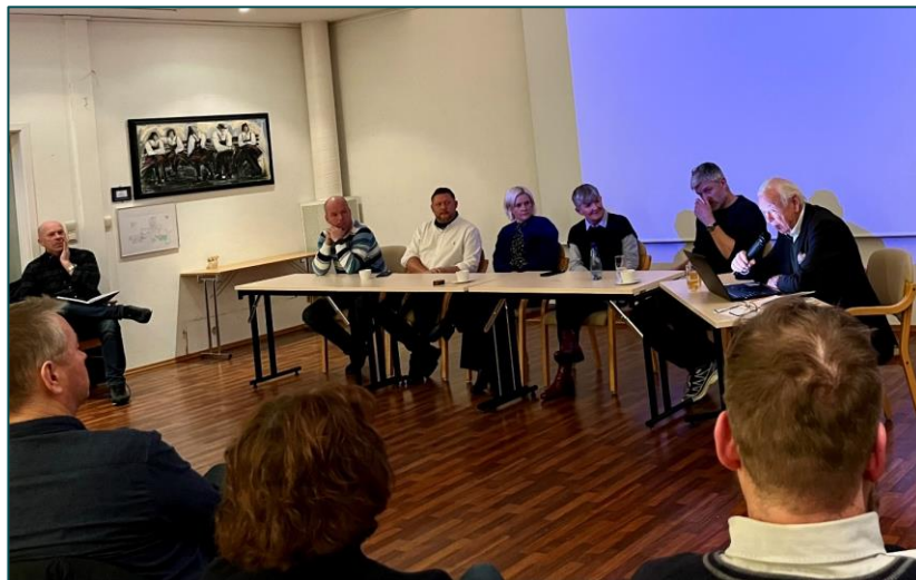
Folkemøte om omstillingsprogram i Byglandsfjord.

Hittil i 2024 har det vært avholdt to møter i «arbeidsinkluderingsgruppa», som har som formål så sikre matching av ledig arbeidskraft og ledige jobber. Foruten Driv som fasilitator, består gruppen av NAV, Drangedal produkter, Keops, flyktningetjenesten, voksenopplæringen, frivilligsentralen og næringsforeningen. I løpet av høsten planlegges aktiviteter som treffpunkt/matchedag, og det er fra omkringliggende kommuner ytret ønske om et regionalt samarbeid.