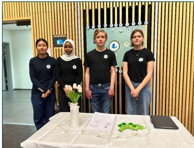
Vinnergruppen «Papirfulgen» i Ungt entreprenørskapsuka.

16. januar møtte Driv også kommunal- og distriktsminister Erling Sande da han var på snarvisitt innom Drangedal. Budskapet var blant annet viktigheten av å opprettholde ordningen med regionale omstillingsmidler og at de gis i et forutsigbart løp, ettersom utviklingsprosjekter tar tid for å lykkes.