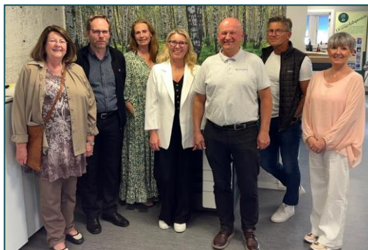
Åpent møte om bærekraft som Good Business.

Siden oppstarten av omstillingsarbeidet (høsten 2022) er det nå tilført lokalt næringsliv 3.826.784 kroner i utviklingsmidler.