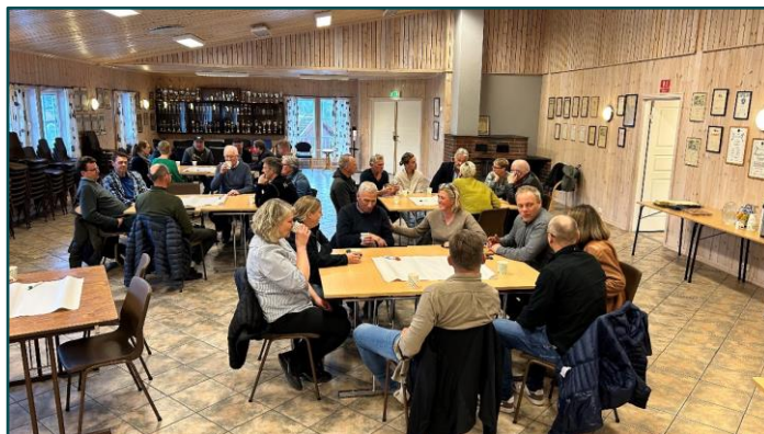
Kick off for Næringsvennlig kommune-programmet mars 2024.