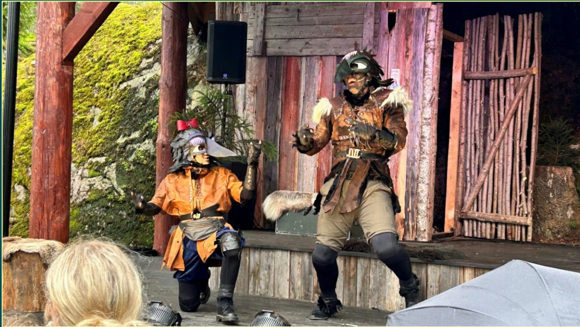
Sommershow med Hugin og Munin – prosjekt Forn Speki