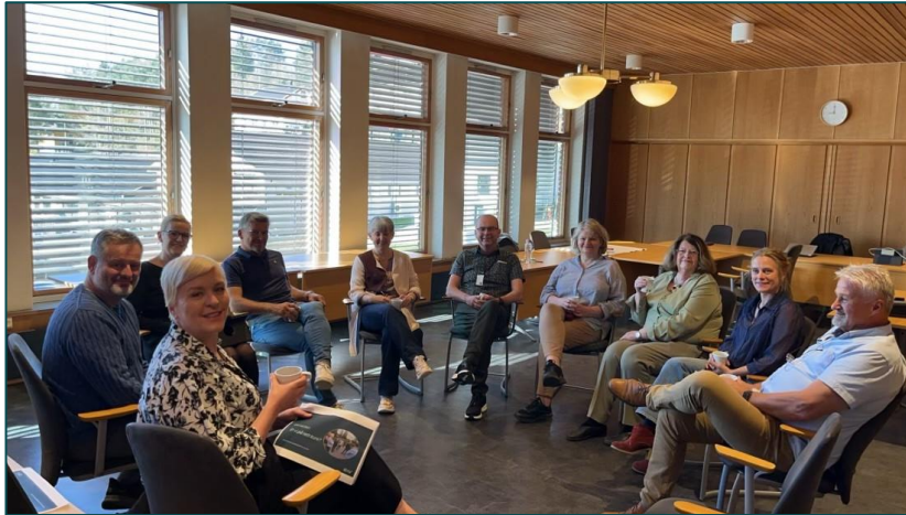
Verksted for Driv-styret.