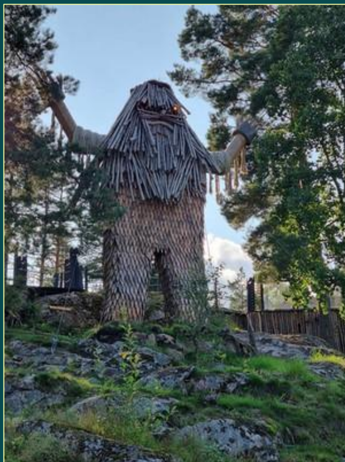
Urjotnen Yme utformet og fotografert av Per Esborg – prosjekt Forn Speki