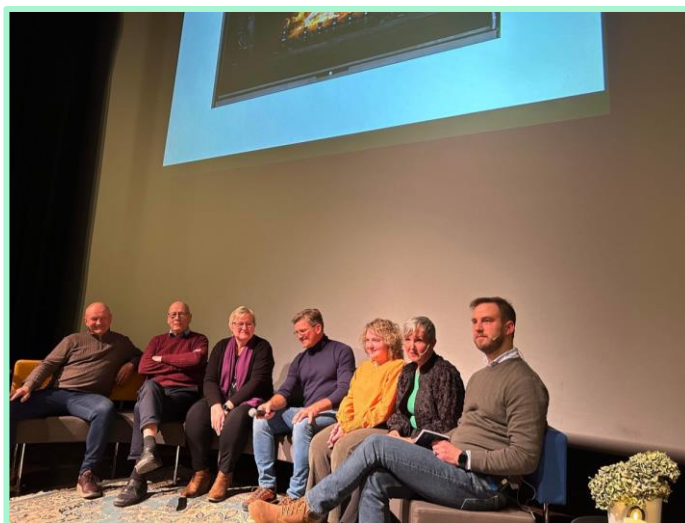
«Sofasamtale» Drivkraft 2023