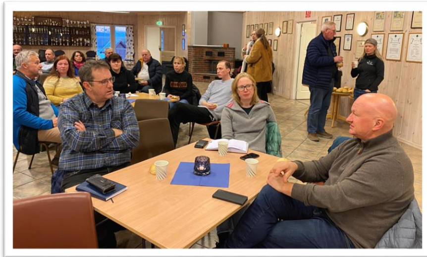
Glimt av fremmøtte